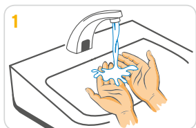
1 Hände mit Wasser anfeuchten.