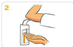
2 1-2 Pumpstöße auf eine Handfläche geben.