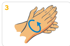
3 Handflächen aneinander reiben, bis sich Schaum bildet. Danach die Hände gründlich waschen.