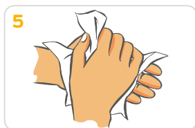
5 Hände gründlich mit einem Wegwerfhandtuch abtrocknen.